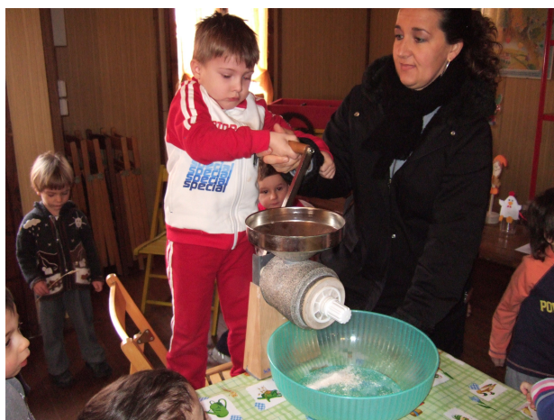
... un bambino alle prese con il mulino...