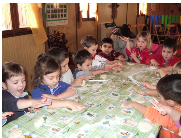
...momenti di manipolazione...