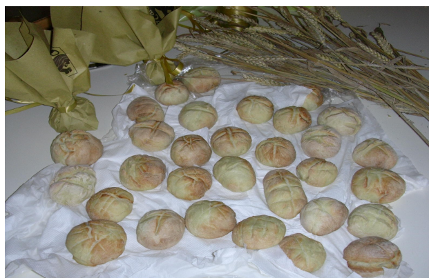
... il pane cotto...